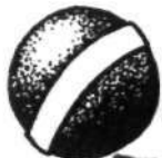
BOLA DE CRICKET